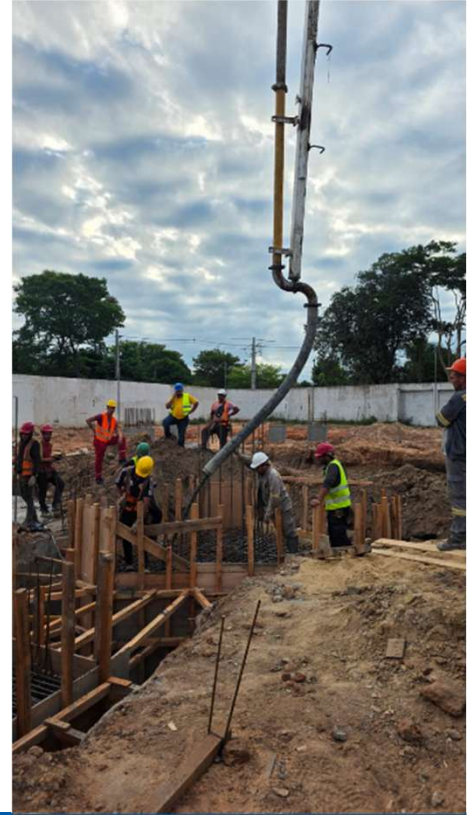
Armado, encofrado y cargamento de cabezales